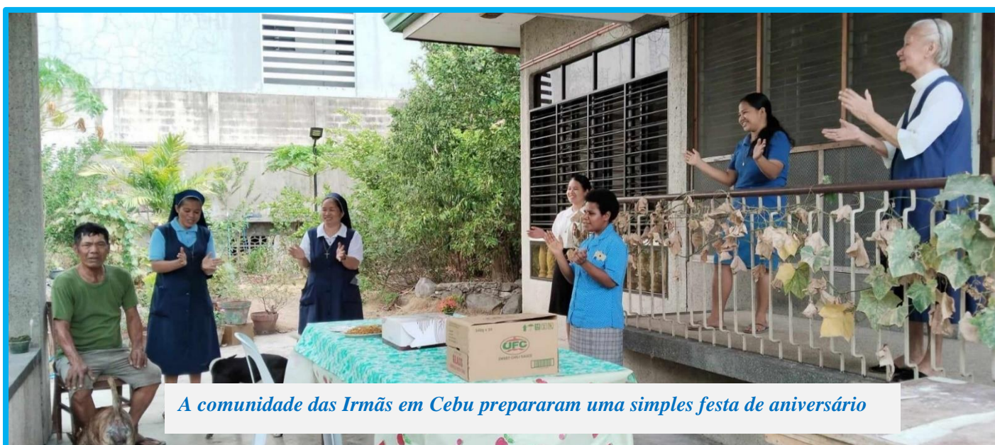
A comunidade das Irmãs em Cebu prepararam uma simples festa de aniversário