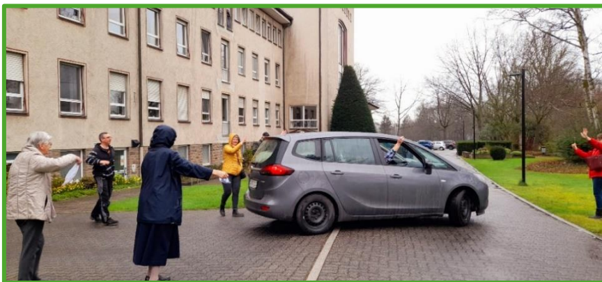
Irmãs se despedem do lar onde viveram muitos anos.