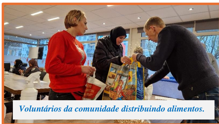
Voluntários da comunidade distribuindo alimentos.

ficou em Brabant Norte, Flevolanda, Limburg e Sul da Holanda, regiões conhecidas pela agricultura e indústria.