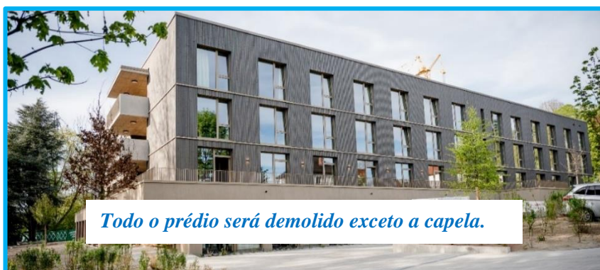
Todo o prédio será demolido exceto a capela.

bênção e paz que influencia nossa vida diária e de todos os residentes”.