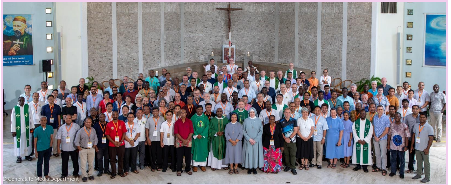
Na celebração do Dia da Família Arnaldina (SVD, SSpS, SSpSAP) no Capítulo Geral SVD.