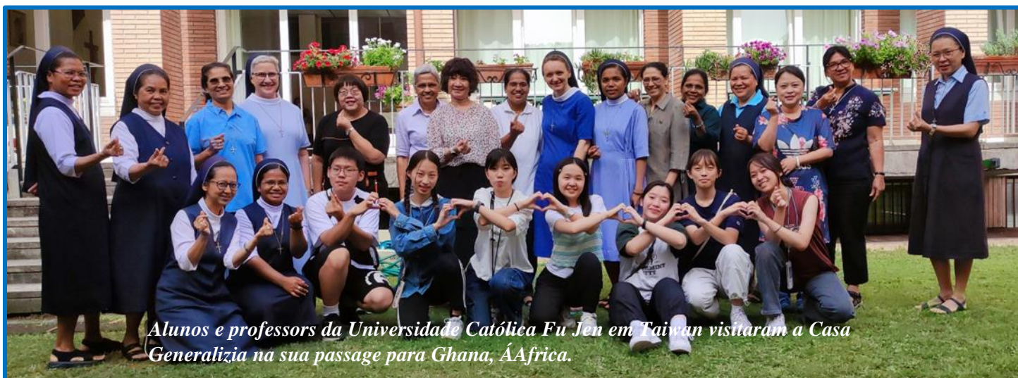
Alunos e professores da Universidade Católica Fu Jen em Taiwan visitaram a Casa Generalizia na sua passagem para Ghana, África.