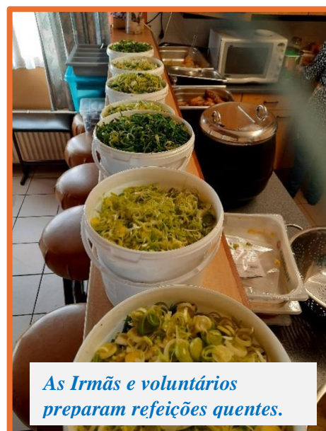
As Irmãs e voluntários preparam refeições quentes.

A continuidade dos esforços é possível graças à generosidade dos benfeitores, cuja contribuição subsidia estes serviços de apoio vital aos membros mais vulneráveis da comunidade.