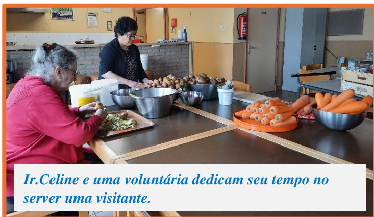
Ir. Celine e uma voluntária dedicam seu tempo no server uma visitante.

No coração de Brabant, Holanda, uma missão transforma vidas, ao oferecer esperança e apoio a migrantes Poloneses e famílias locais em dificuldades.