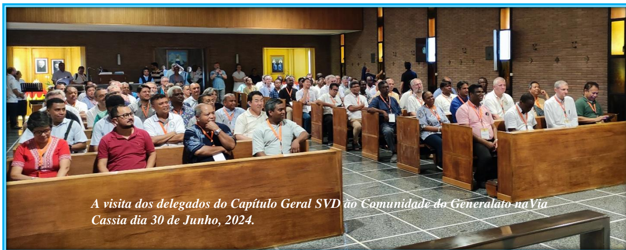
A visita dos delegados do Capítulo Geral SVD à Comunidade do Generalato na Via Cassia dia 30 de Junho, 2024.